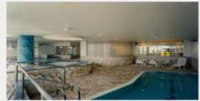
健康浴ゾーン（水着着用）