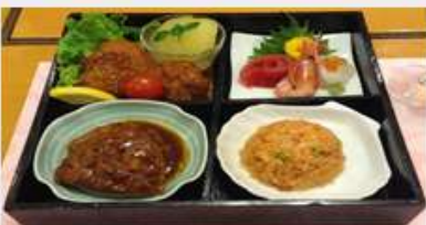
子供用夕食（イメージ）