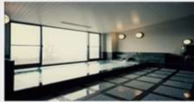
サウナ付温泉大浴場