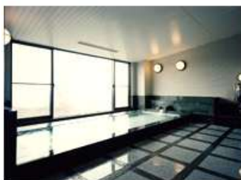
サウナ付温泉大浴場