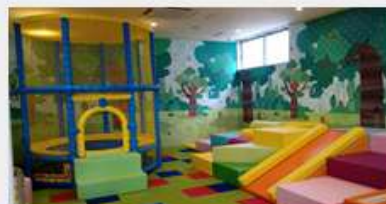
子ども遊戯場（トランポリン&凸凹プレイランド） （イメージ）