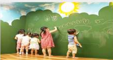
らくがき黒板ルーム（イメージ）