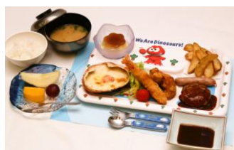
子供用夕食イメージ