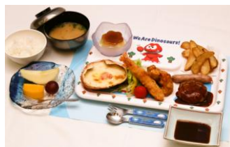
子供用夕食イメージ